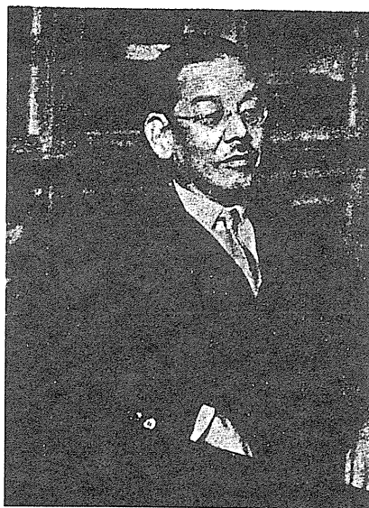
日本漢學家 古城貞吉

汪康年1896年創辦旬刊《時務報》，“廣譯五洲近事”是其主要內容之一，為了使國人“知全地大局，與其強盛弱亡之故，而不苟至夜郎自大，坐井以議天地”。汪康年認為“非廣譯東西文各報，無以通彼己之郵”。《時務報》在籌備階段汪即委託妻弟查雙綬在日本物色日文翻譯人員，最後選定日本熊本人，漢學家古城貞吉（字坦堂）擔當譯事。 [2] 《時務報》從第3冊（1896.8.29）起開始登載“東文報譯”欄，至1898年8月8日第69冊止，共刊登59回。總翻譯量超過40萬字，為中國社會提供了大量的信息。從目前的情況看，“東文報譯”欄均為古城所譯。